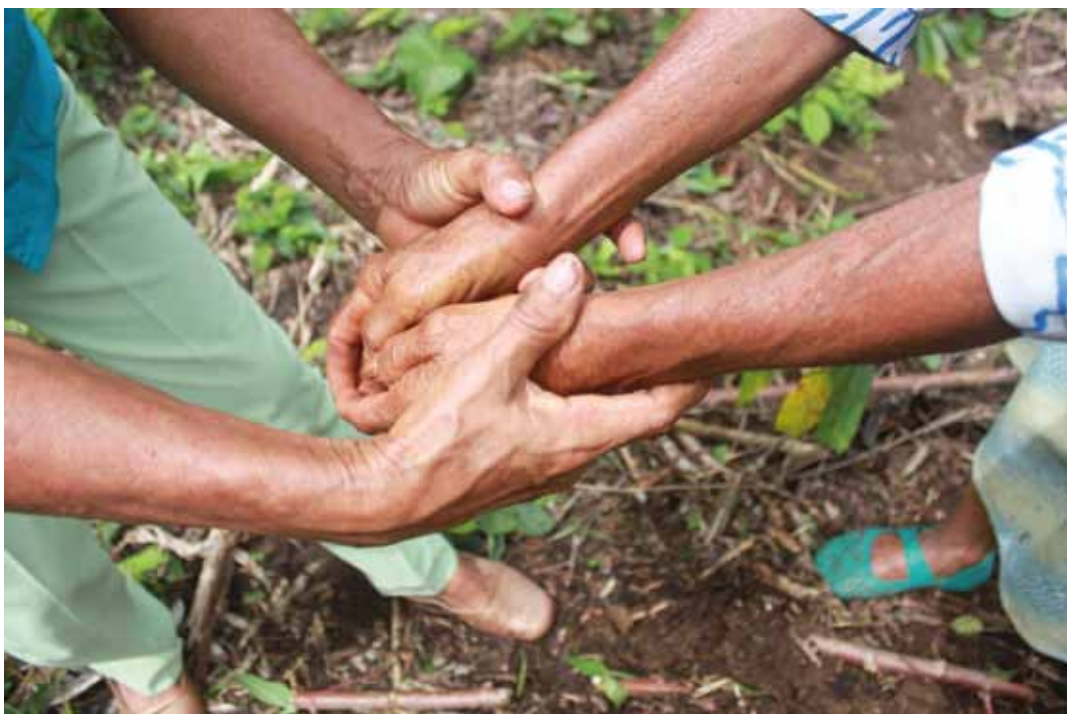
Rito de transmisión del paju

La ordenanza provincial, principalmente constituye el reconocimiento legal de la existencia de la Chakra Kichwa Amazónica; podemos decir que la ordenanza es la partida de nacimiento legal de la chakra.