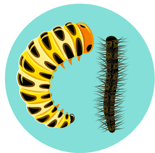
CORTADORES COGOLLERO (Lepidoptera: Noctuidae: Agrotis sp.)